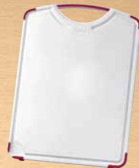
Planche à découper