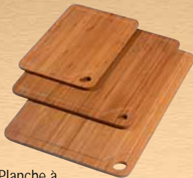
Planche à découper Slim